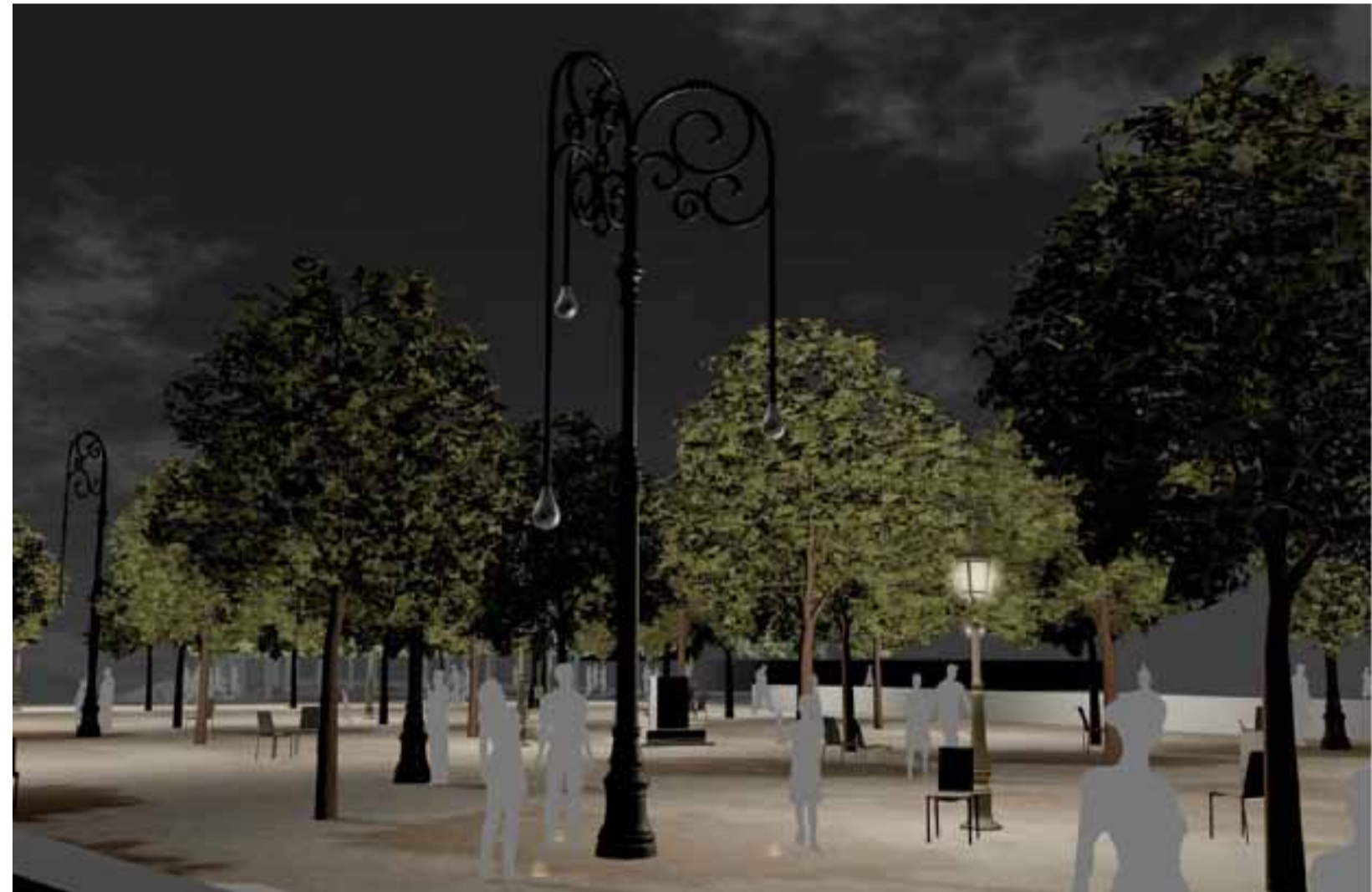
L'ŒUVRE DES RÉVERBÈRES DE LA MÉMOIRE, COMPOSÉE DE NEUF RÉVERBÈRES DE HUIT MÈTRES DE HAUT, EST INSPIRÉE DES LAMPADAIRES DE NEW YORK

La découverte des vestiges de l'église Saint-Laurent a clos le débat et scellé l'abandon du projet d'implantation du monument. Alors, qu'est-ce qui fait l'Histoire? Des fouilles qui mettent au jour un passé vieux de plus de 400 ans, un monument commémorant un événement du siècle dernier, ou les deux? Initialement prévue en avril 2012, la réalisation de