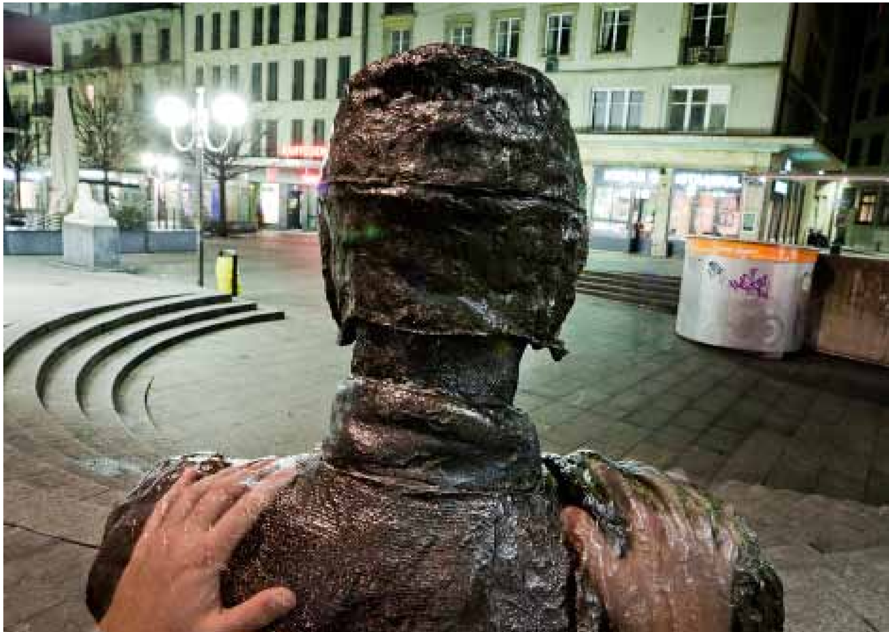
SCULPTURE DE BRONZE REPRÉSENTANT UN HOMME ASSIS AVEC, SUR SES GENOUX, UN JOURNAL, L'IMMIGRÉ REND HOMMAGE À CELLES ET CEUX QUI ONT QUITTÉ LEUR PAYS ET SE SONT, POUR DES MOTIFS DIVERS, INSTALLÉS À GENÈVE.