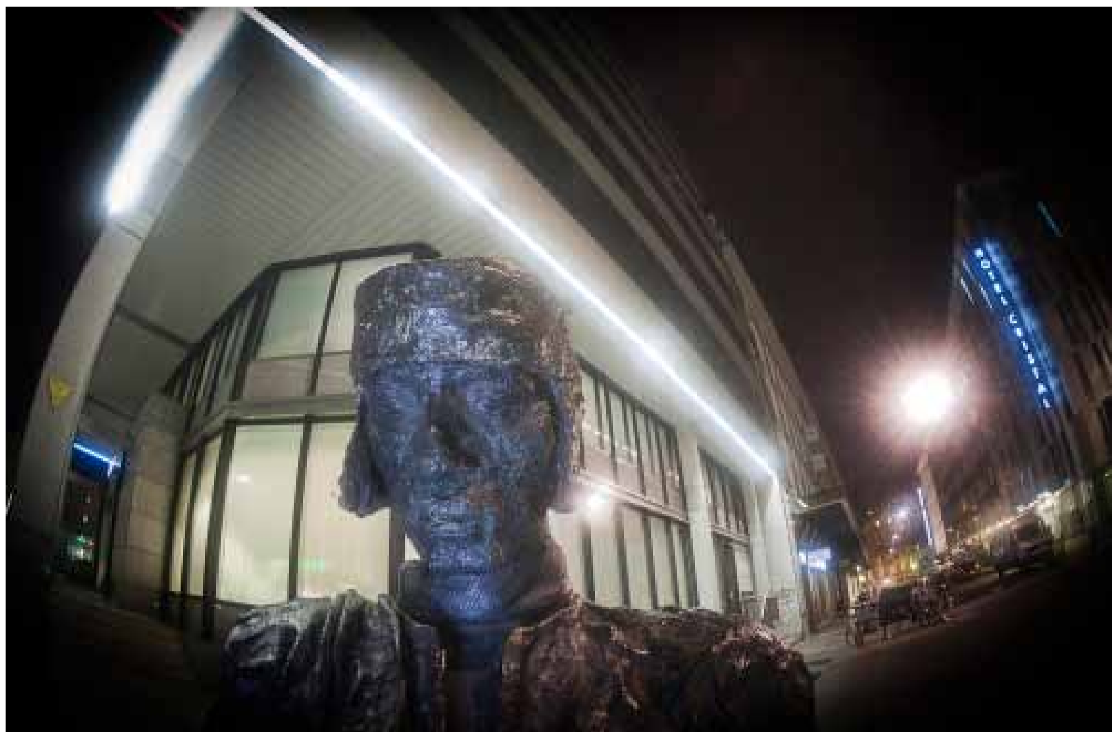
L'IMMIGRÉ. SUR LA SCULPTURE ELLE-MÊME AUCUNE INDICATION N'EST DONNÉE. IL FAUT DESCENDRE LES MARCHES QUI MÈNENT À LA RUE PIETONNE, PLACE DU MONT-BLANC, POUR DÉCOUVRIR PAR TERRE UNE PLAQUE AVEC DES INFORMATIONS. © ALBERTO CAMPI / MARS 2013